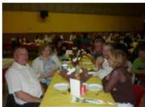
Nos amis de Cambrai