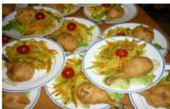
Les entrées en attente du service