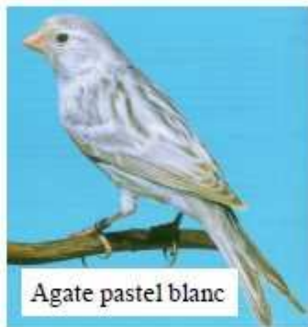
Agate pastel blanc

Le facteur pastel, également appelé 2 ème facteur de réduction, agit sur la mélanine.