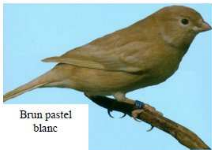
Brun pastel blanc

Pour les bruns schimmels, un maximum de phaeomélanine brune est demandé.