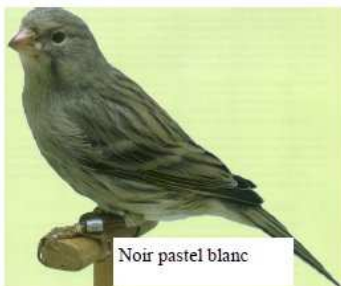
Noir pastel blanc