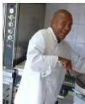
Le chef cuisinier