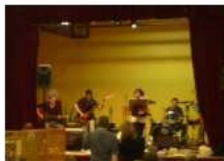
Un orchestre dynamique