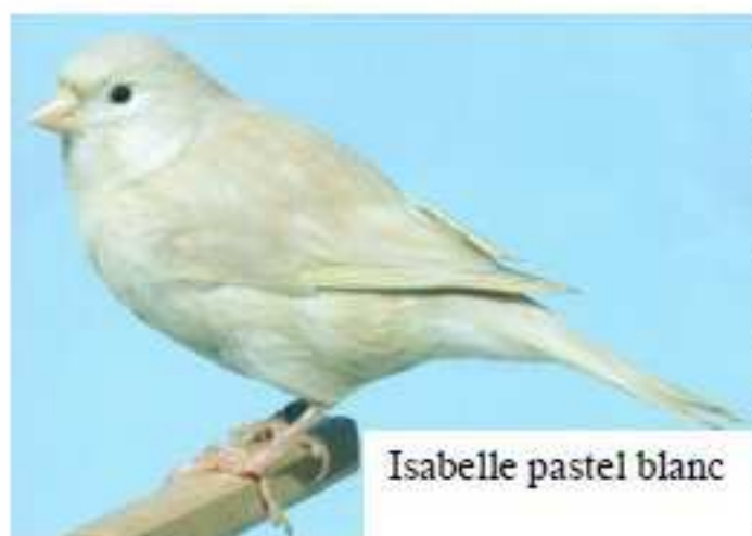
Isabelle pastel blanc