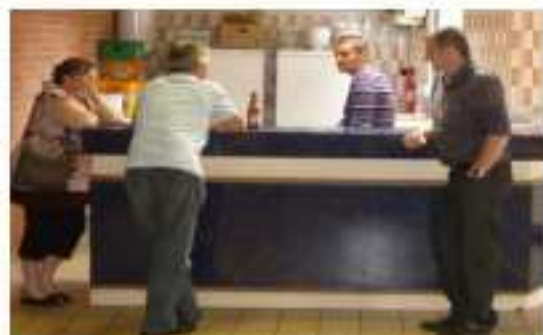
Nos amis de Bâchant