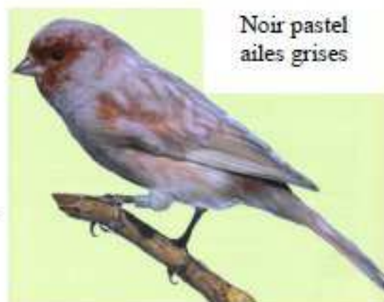
Noir pastel ailes grises

Pour les noirs et les bruns, la quantité d'eumélanine est identique, il sera demandé chez les noirs une strie gris-noir et brune chez les bruns.