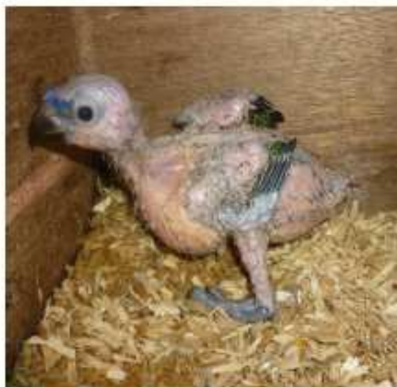
Oiseau piqué en 2010

Malgré cela ils restent des oiseaux agréables à regarder car ils sont curieux, joueurs et surtout intelligents.