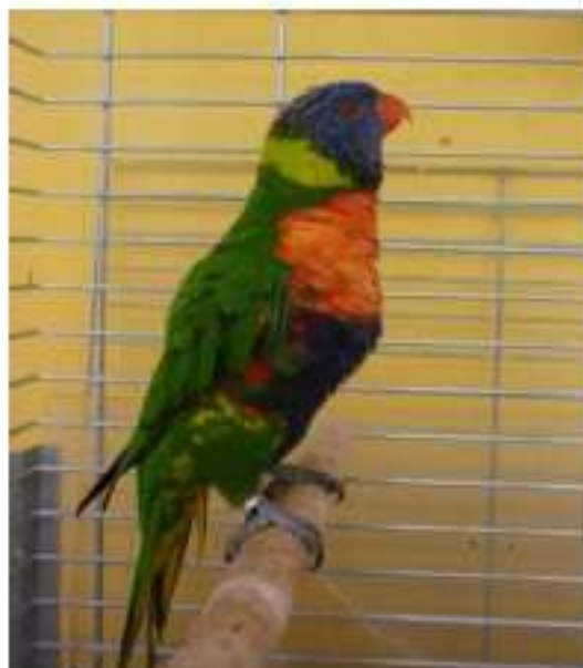
Le même en 2011