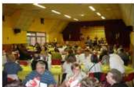
Une salle accueillante