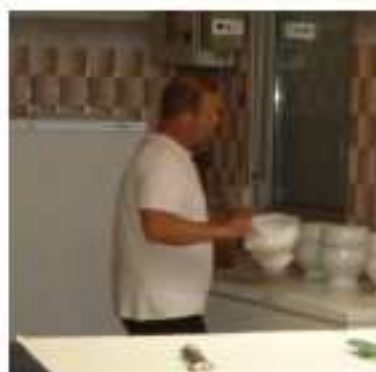
Préparation du bar